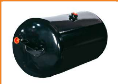
RA020CA - Reservatório de Ar 20 Its