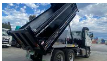
Tanque de Óleo - Automotiva Pesada