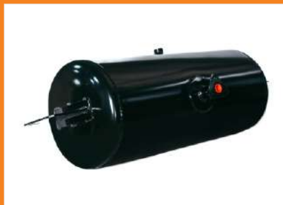
RA040CA - Reservatório de Ar 40 Its