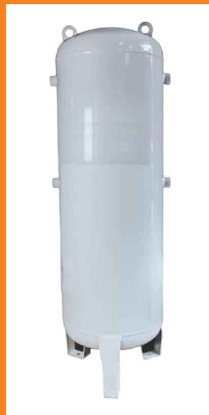
RD500V - Vaso de Pressão de 500 Its