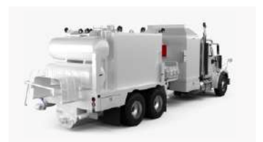
Projetos Especiais - Reservatórios Metálicos