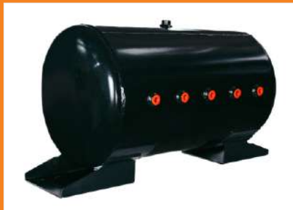
RA115 - Reservatório de Ar 115 Its