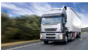
Reservatório de Ar - Automotiva Pesada