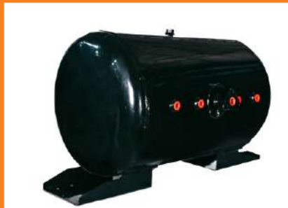
RA115CT - Reservatório de Ar 115 Its