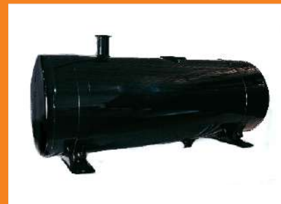
R0180 - Reservatório de Óleo 180 Its