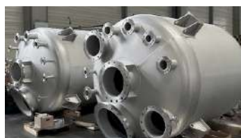
Vasos de Pressão - Linha Industrial