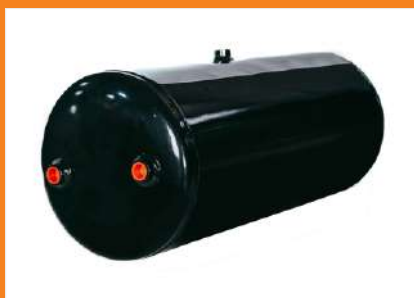
RA040SA - Reservatório de Ar 40 Its